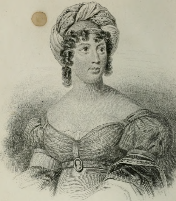
M ME LA BARONNE DE STAEL.